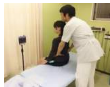
筋肉と骨格の調整