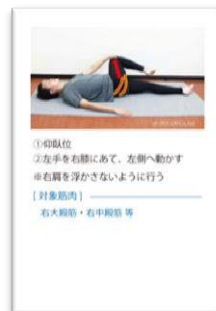
個別のストレッチ・テーピングメニューを メール配信、または紙面にてお渡し。 アドバイス、自宅ケア