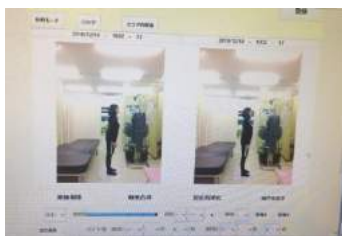
今までにない合成写真で ビフォーアフターを比較。 施術後の再チェック