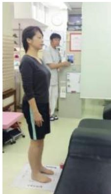
バランス・動き・歪み 検査